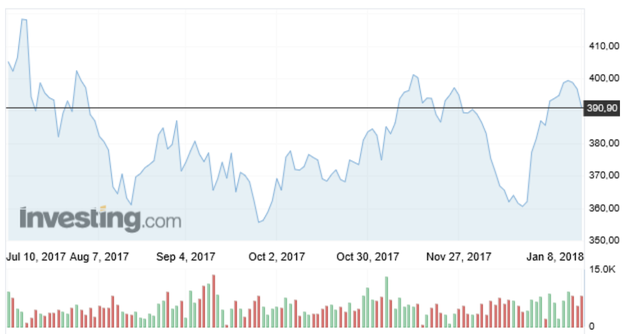
Wykres 2. Ceny cukru w okresie 10 lipiec 2017– 8 styczeń 2018 r. (Kontrakt terminowy, London Sugar No. 5, USD/t, cukier biały)