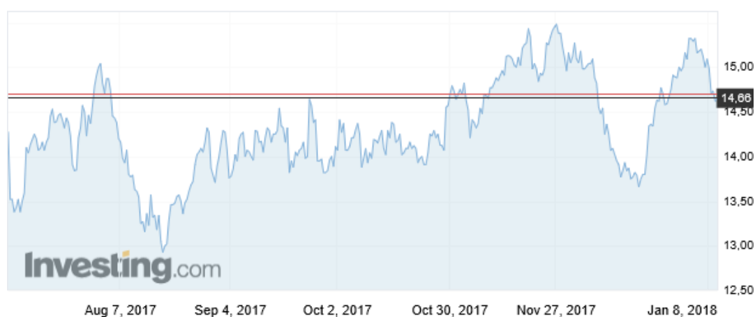
Wykres 4. Ceny cukru surowego w okresie 10 lipiec 2017 – 8 styczeń 2018 r. (Kontrakty terminowe na cukier US nr 11, US cent/funt, cukier surowy)