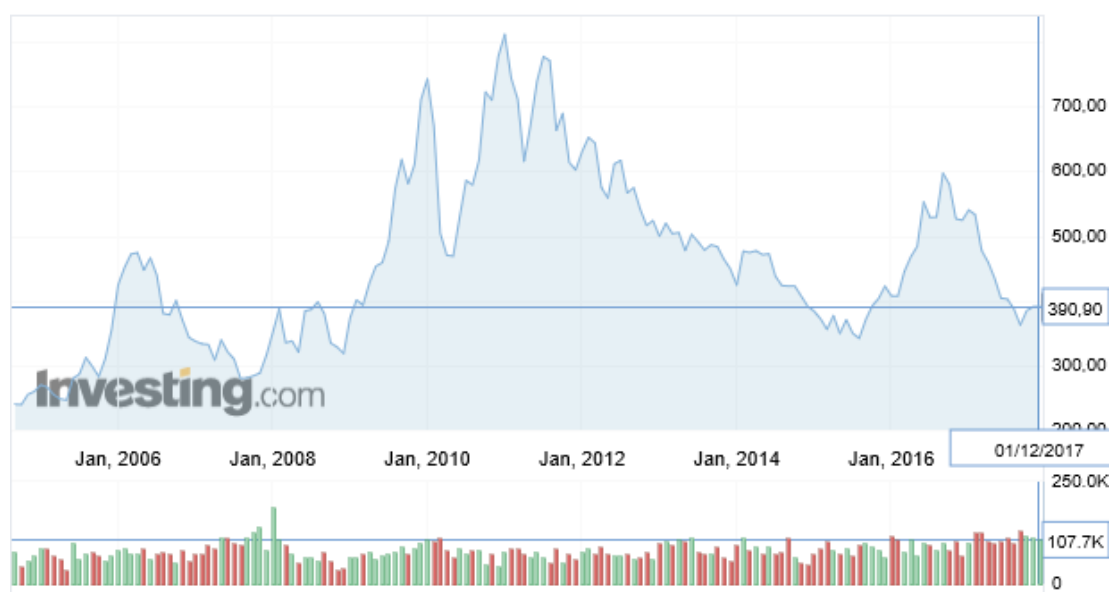
Wykres 3. Ceny cukru 2006 - 2018 r. (London Sugar No. 5, USD/t, cukier biały)