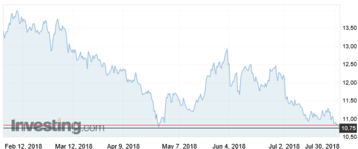
Wykres 4. Ceny cukru surowego w okresie 1 luty 2018– 30 lipiec 2018 r. (Kontrakty terminowe na cukier US nr 11, US cent/funt, cukier surowy)