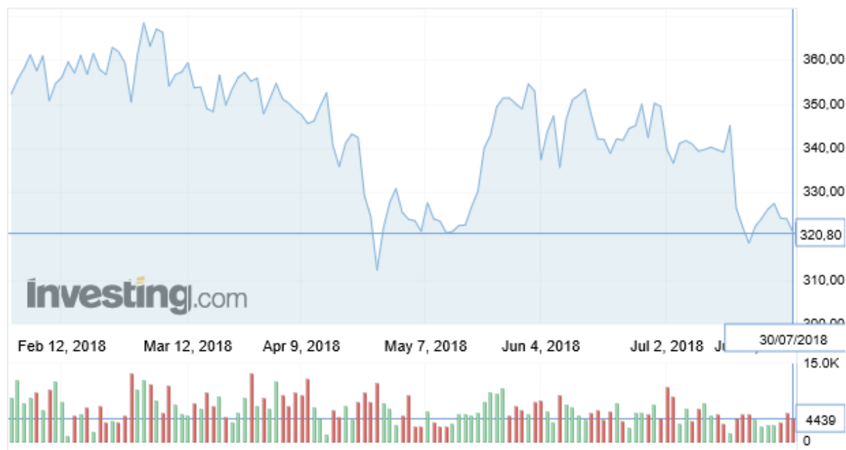
Wykres 3. Ceny cukru w okresie 1 luty 2018– 30 lipiec 2018 r. (Kontrakt terminowy, London Sugar No. 5, USD/t, cukier biały)