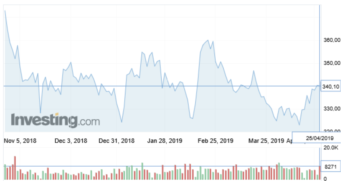
Wykres 2. Ceny cukru w okresie 26.10.2018 – 25.04.2019 r. (Kontrakt terminowy, London Sugar No. 5, USD/t, cukier biały)