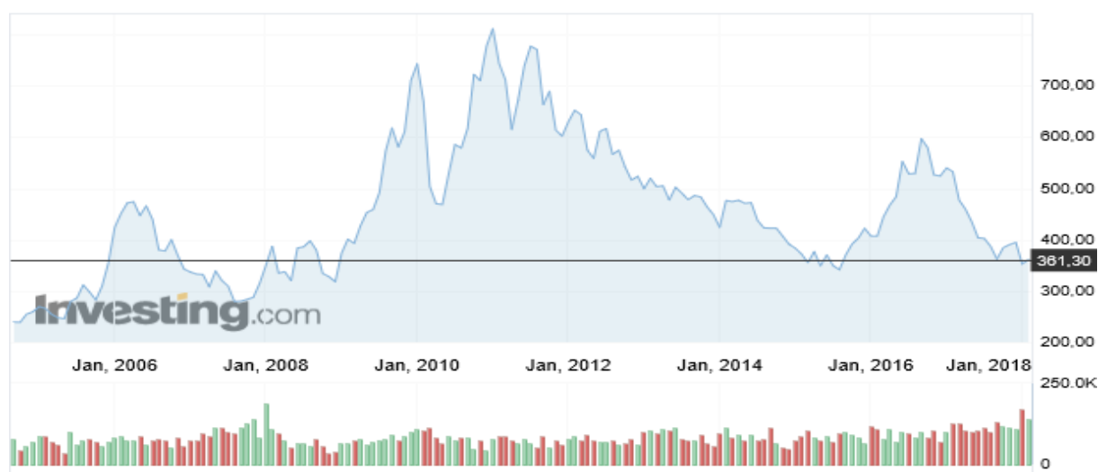
Wykres 3. Ceny cukru 2006 - 2018 r. (London Sugar No. 5, USD/t, cukier biały)