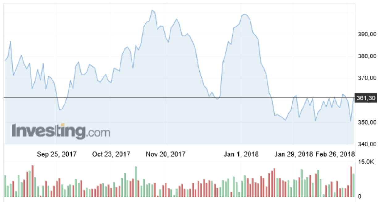
Wykres 2. Ceny cukru w okresie 1 wrzesień 2017– 28 luty 2018 r. (Kontrakt terminowy, London Sugar No. 5, USD/t, cukier biały)