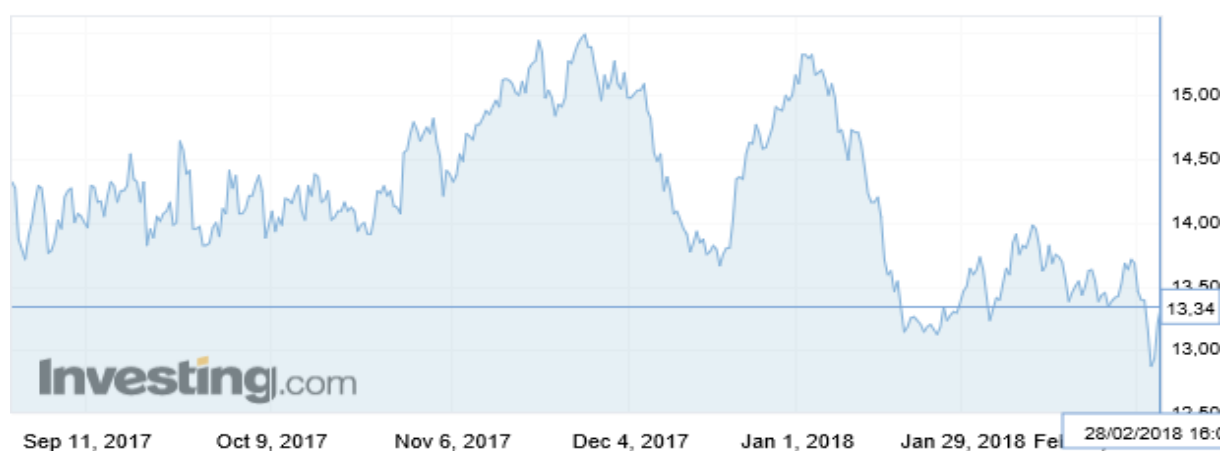
Wykres 4. Ceny cukru surowego w okresie 1 września 2017 – 28 lutego 2018 r. (Kontrakty terminowe na cukier US nr 11, US cent/funt, cukier surowy)